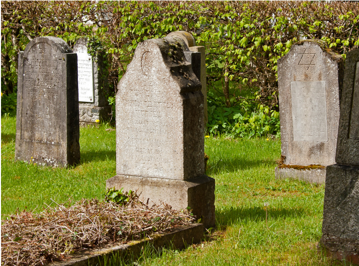
Grabsteine auf dem jüdischen Friedhof in Schleiden-Gemünd (2013).

Fachsicht(en): Kulturlandschaftspflege, Landeskunde