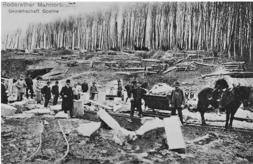
Roderather Marmorbruch, ca. 1911

Fachsicht(en): Kulturlandschaftspflege, Denkmalpflege, Landeskunde, Architekturgeschichte