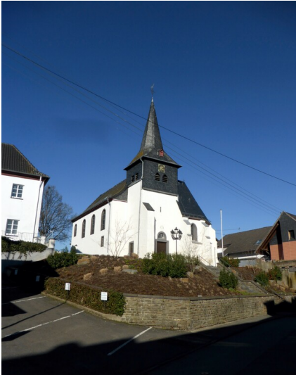
Katholische Pfarrkirche Sankt Michael in Franken (2023)

Fachsicht(en): Kulturlandschaftspflege, Denkmalpflege, Archäologie