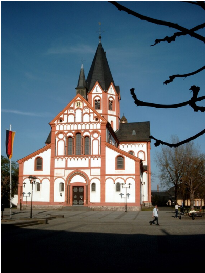
Katholische Pfarrkirche Sankt Peter in Sinzig (2001)

Fachsicht(en): Denkmalpflege, Archäologie