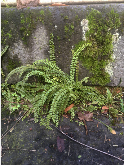
Innenseite der nördlichen Außenmauer der Stadt Zons (2018)