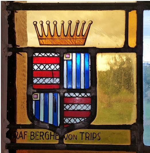
Das Wappen der Grafen Berghe von Trips, dargestellt in einem Fenster der Kapelle am Haardthof bei Altrich im Landkreis Bernkastel-Wittlich (2022).

Fachsicht(en): Kulturlandschaftspflege , Landeskunde , Architekturgeschichte