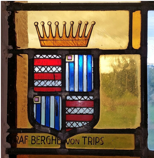
Das Wappen der Grafen Berghe von Trips, dargestellt in einem Fenster der Kapelle am Haardthof bei Altrich im Landkreis Bernkastel-Wittlich (2022).

Fachsicht(en): Kulturlandschaftspflege, Landeskunde, Architekturgeschichte