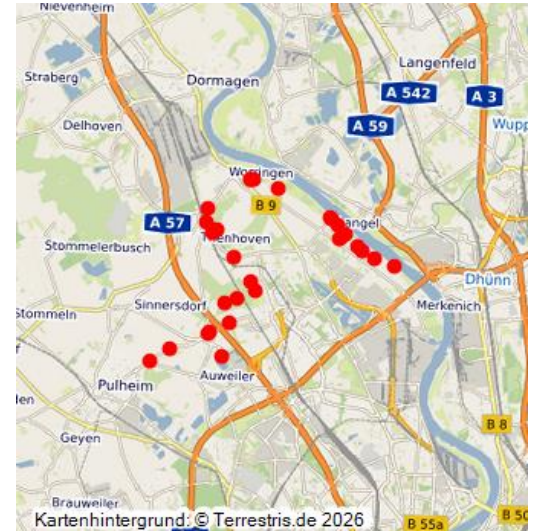
Abb. 1: Der Wassererlebnispfades von Pulheim zum Rhein im Kartenbild (2018)

Der „Wassererlebnispfad von Pulheim zum Rhein“ (Abbildung 1) bildet die Fortsetzung des Wassererlebnispfades Pulheimer Bach . Er umfasst 31 Erzählstationen und vier mit besonders umfangreichen Informationen ausgestattete Ankerpunkte zwischen Pulheim und dem Rhein bei Merkenich (Köln).