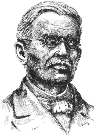
Friedrich Wilhelm Raiffeisen (1818-1888)

Federzeichnung Friedrich Wilhelm Raiffeisens (o. J.)