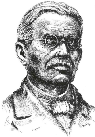
Friedrich Wilhelm Raiffeisen (1818-1888)

Federzeichnung Friedrich Wilhelm Raiffeisens (o. J.)