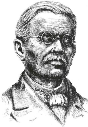
Friedrich Wilhelm Raiffeisen (1818-1888)

Federzeichnung Friedrich Wilhelm Raiffeisens (o. J.)