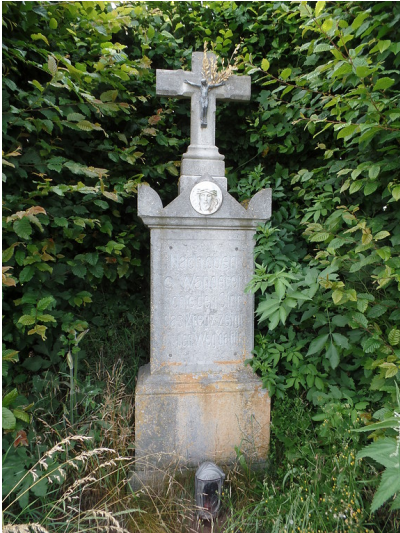
Wegekreuz Glehn, Kermeterstraße (2018)