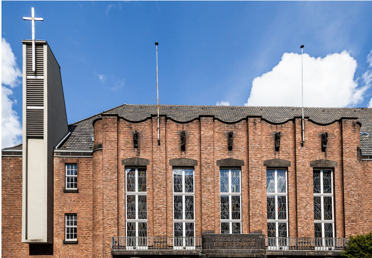
Evangelische Kirche Tersteegenhaus in Köln-Sülz (2021)

Fachsicht(en): Denkmalpflege, Architekturgeschichte