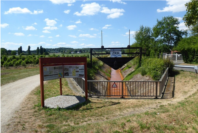
Ankerpunkt Aachener Straße des Lehr- und Erlebnispfads Energie & Wasser am Kölner Randkanal (2020)