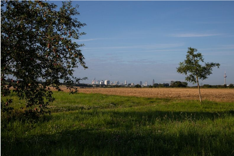
Blick auf die Frankfurter Skyline aus den Heilsberger Streuobstwiesen in Bad Vilbel (2021)

Fachsicht(en): Landeskunde, Kulturlandschaftspflege