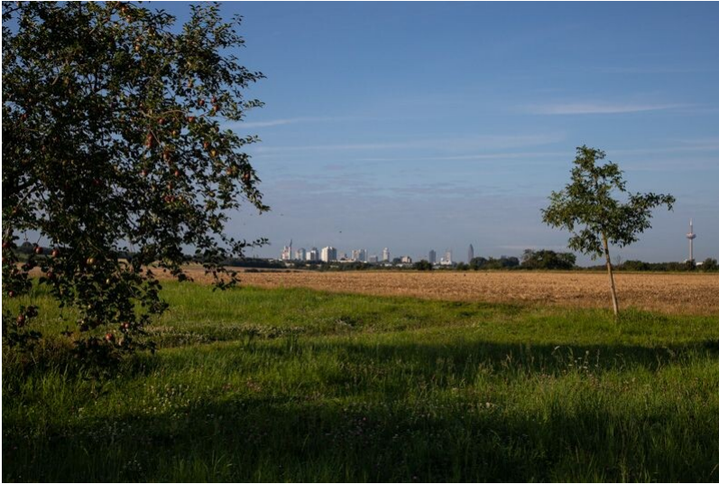
Blick auf die Frankfurter Skyline aus den Heilsberger Streuobstwiesen in Bad Vilbel (2021)

Fachsicht(en): Landeskunde, Kulturlandschaftspflege