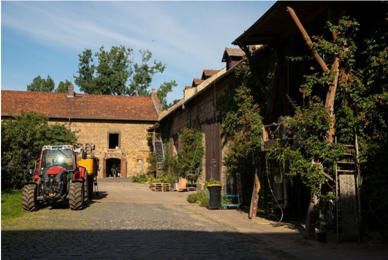
Dottenfelder Hof in Bad Vilbel (2021)

Fachsicht(en): Kulturlandschaftspflege, Landeskunde