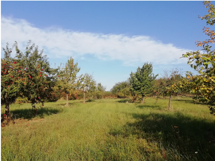
Die Streuobstwiese „Brachholz“ bei Bornheim mit fruchtenden Apfelbäumen links im Bild (2018).

Fachsicht(en): Kulturlandschaftspflege, Naturschutz