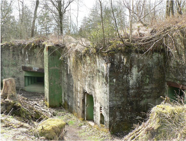
Die Bunker im Waldgebiet "Buhlert" bei Simmerath (2008)

Fachsicht(en): Kulturlandschaftspflege, Landeskunde