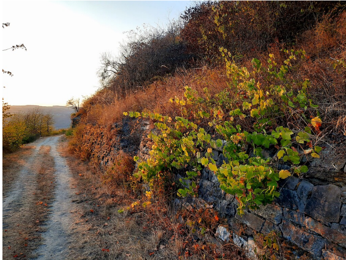
Verwilderte Weinreben wachsen an einer alten Weinbergsmauer eines brachgefallenen Weinbergs oberhalb von Lorch, fotografiert entlang des "In Vino Veritas-Wisper-Trail"-Wanderwegs (2020).