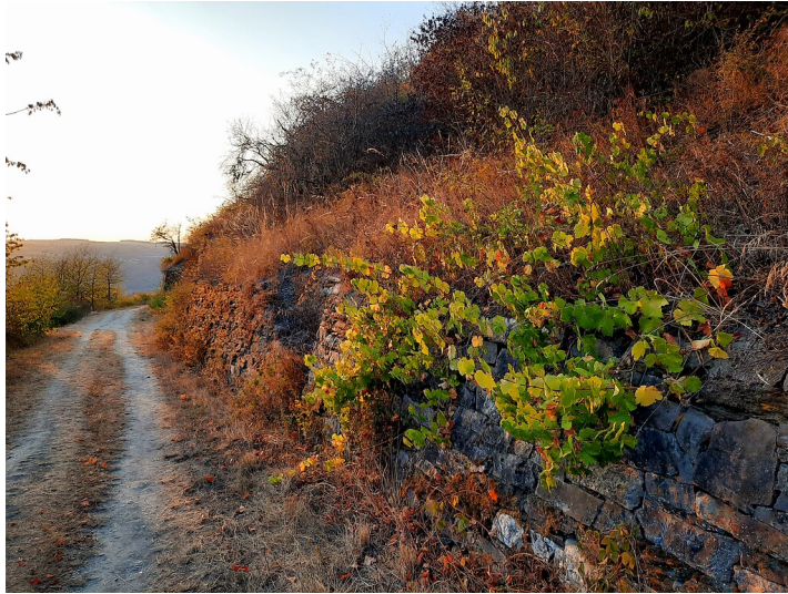
Verwilderte Weinreben wachsen an einer alten Weinbergsmauer eines brachgefallenen Weinbergs oberhalb von Lorch, fotografiert entlang des "In Vino Veritas-Wisper-Trail"-Wanderwegs (2020).