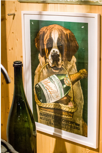
Historisches Werbeplakat der Sektkellerei Burgeff im Weinbaumuseum Hochheim am Main (2016)