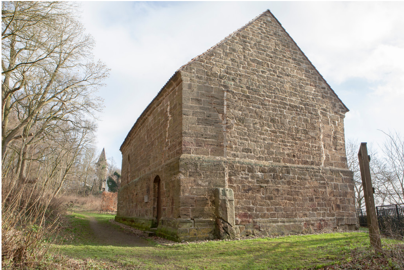
Margarethen-Klus-Kapelle in Porta Westfalica (2015)

Fachsicht(en): Kulturlandschaftspflege, Denkmalpflege