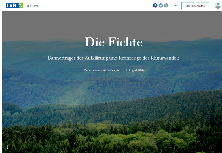
Die Fichte - eine StoryMap