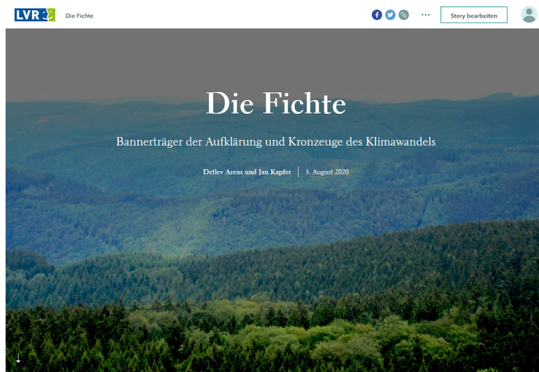
Die Fichte - eine StoryMap Fotograf/Urheber: Jan Kapfer; Detlev Arens