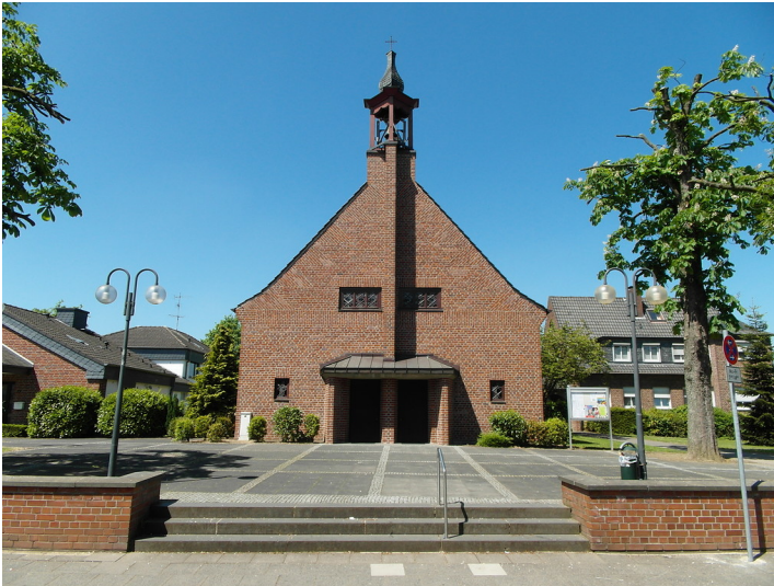
Katholische Pfarrkirche Sankt Paulus in Langenfeld (2013)