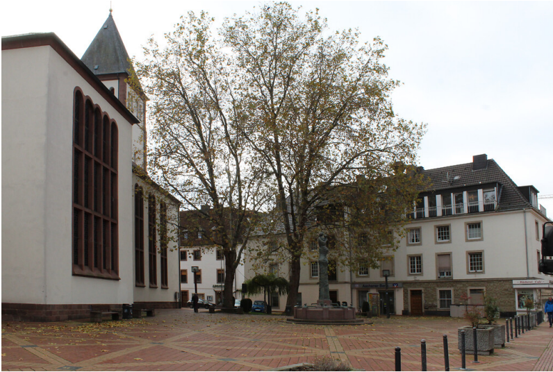
Ansicht aus nördlicher Richtung auf den Kirchplatz der Propsteikirche St. Mariä Himmelfahrt in Jülich (2019).

Fachsicht(en): Kulturlandschaftspflege, Landeskunde, Architekturgeschichte