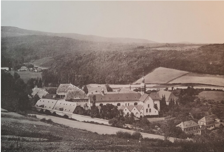
Kloster Eberbach (Ende des 19. Jahrhunderts)

Fachsicht(en): Kulturlandschaftspflege, Landeskunde