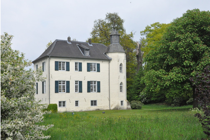
Haus Bey mit Turm (2017)

Fachsicht(en): Kulturlandschaftspflege , Landeskunde , Naturschutz