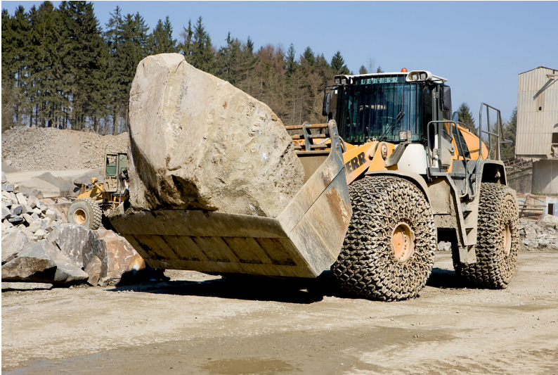
Radlader mit großem Rohblock im Steinbruch der Günter Jaeger Steinbruchbetriebe GmbH in Reichshof (2009)

Fachsicht(en): Kulturlandschaftspflege, Naturschutz