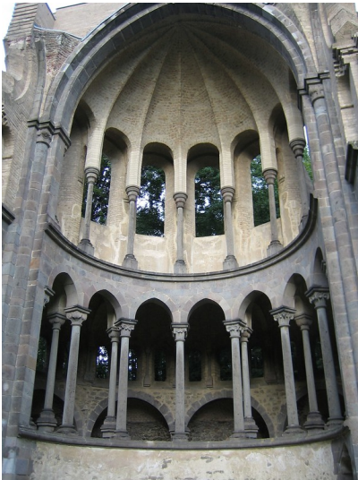
Gewölbe der Chorruipe der Abteikirche der Zisterzienserabtei Heisterbach (2005).