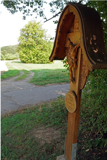
Wegekreuz am Dockmühlenweg/Ecke Milchweg, Bruchhausen (2019)