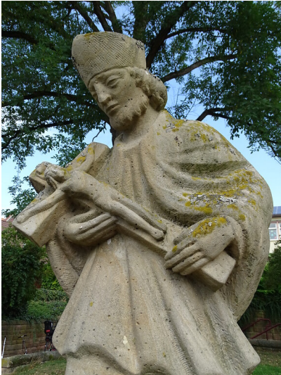
Standbild Johannes Nepomuk in Schaidt (2019)

Fachsicht(en): Landeskunde, Architekturgeschichte