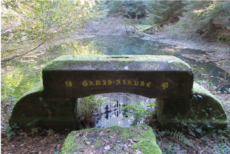
Wasserbauwerk Gambs-Klause im Pfälzerwald (2018)

Fachsicht(en): Landeskunde, Architekturgeschichte