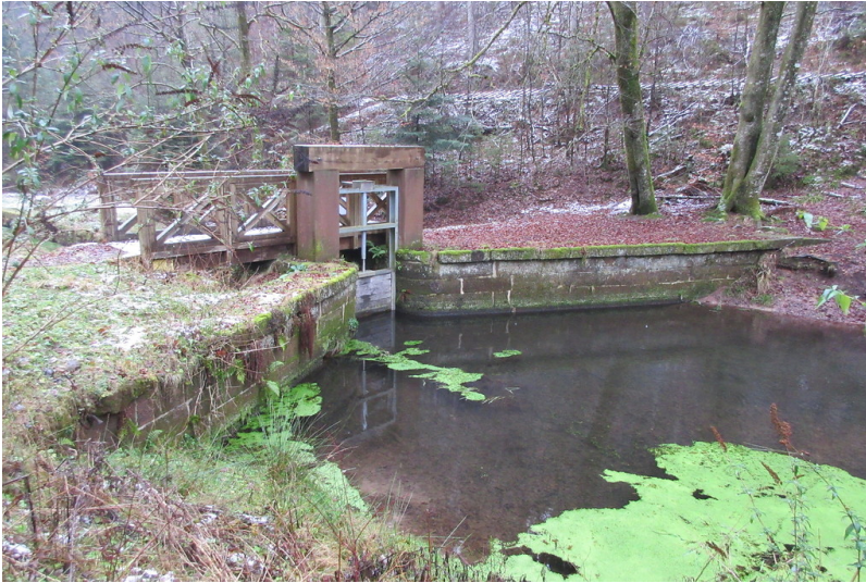
Dammbereich mit dem Absperr- und Auslaufbauwerk

Fachsicht(en): Landeskunde, Architekturgeschichte