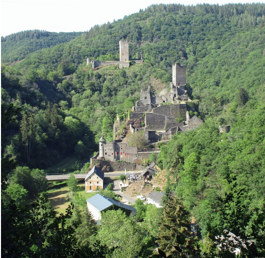
Blick aus südlicher Richtung auf die beiden Manderscheider Burgen, vorne die Niederburg, dahinter die Oberburg (2020).

Fachsicht(en): Kulturlandschaftspflege , Landeskunde