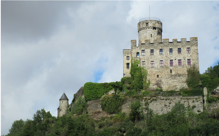
Blick von Osten auf die Burg Pyrmont zwischen Roes und Pillig (2020).

Fachsicht(en): Kulturlandschaftspflege , Landeskunde