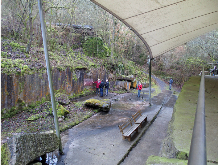
Unica-Bruch in Villmar (2018)

Fachsicht(en): Kulturlandschaftspflege, Landeskunde