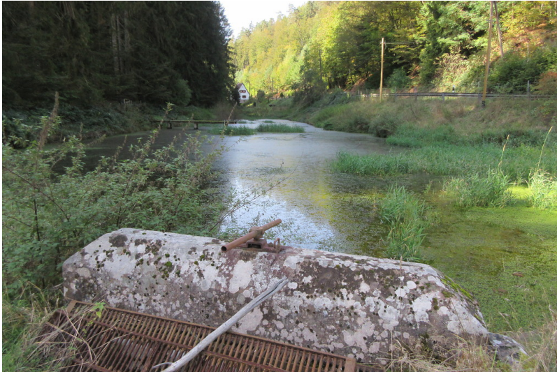
Speyerbrunner Woog

Fachsicht(en): Kulturlandschaftspflege, Landeskunde