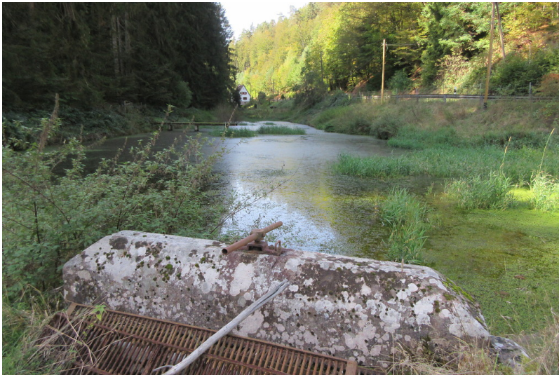
Speyerbrunner Woog

Fachsicht(en): Kulturlandschaftspflege, Landeskunde