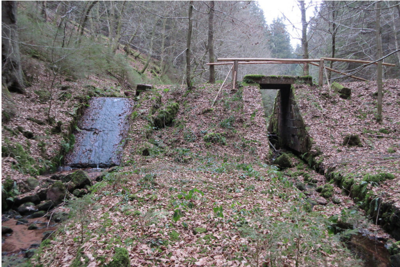
Dammbereich des Goldwooges mit Sohlrampe am Breitenbach (2018)

Fachsicht(en): Kulturlandschaftspflege , Landeskunde