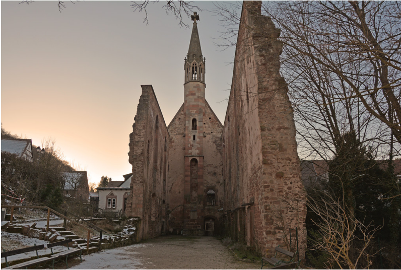
Blick in das ehemalige Kirchenschiff des Klosters Rosenthal in Richtung Turm (2018).

Fachsicht(en): Kulturlandschaftspflege, Denkmalpflege, Landeskunde, Architekturgeschichte