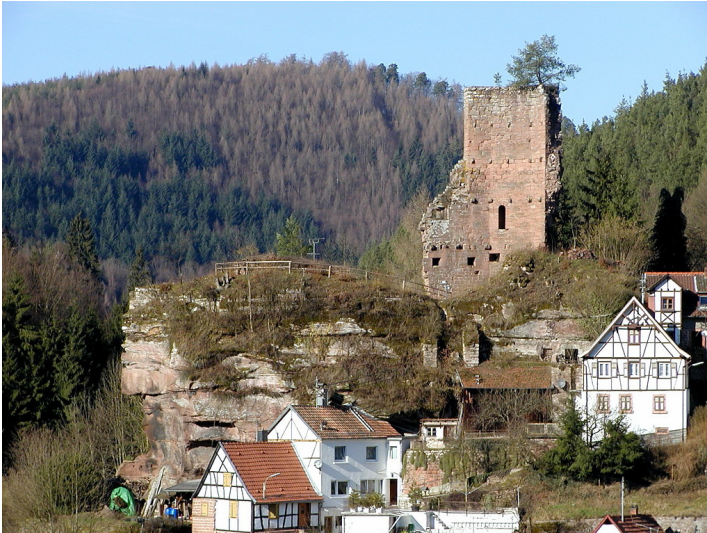
Burgruine Elmstein nördlich des Speyerbaches: Oberburg mit Schildmauer von Süden (2002).

Fachsicht(en): Denkmalpflege, Landeskunde, Architekturgeschichte