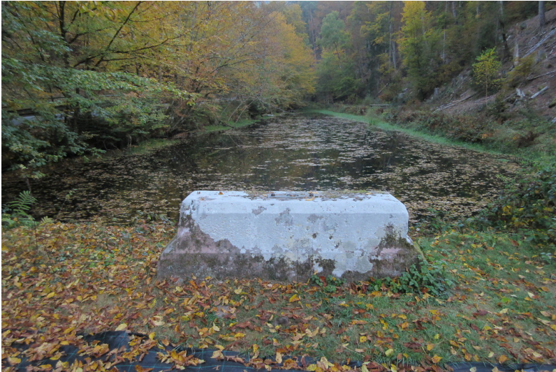
Alter Schmelzwoog am Legelbach (2018)

Fachsicht(en): Landeskunde , Architekturgeschichte , Denkmalpflege