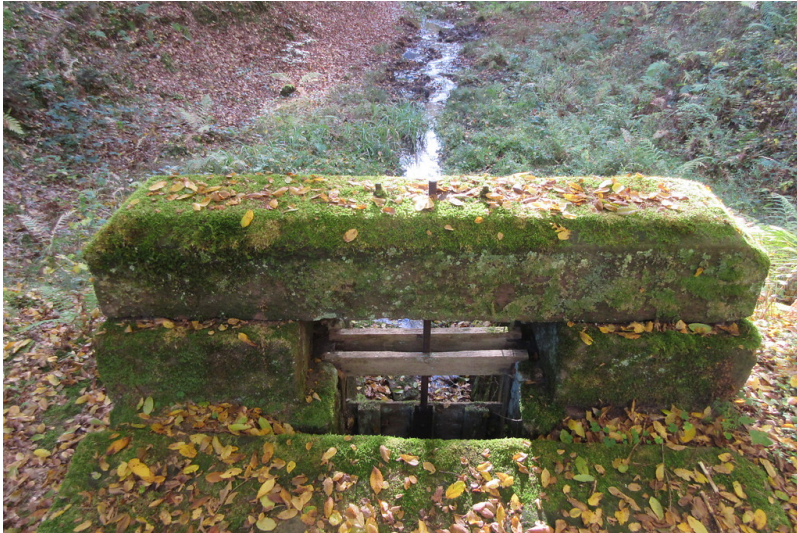
Philippswoog-Absperrbauwerk zur Holztrift am Storrbach (2018)

Fachsicht(en): Denkmalpflege , Landeskunde , Architekturgeschichte