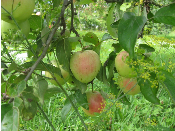
Äpfel auf einer Streuobstwiese.

Fachsicht(en): Kulturlandschaftspflege, Naturschutz