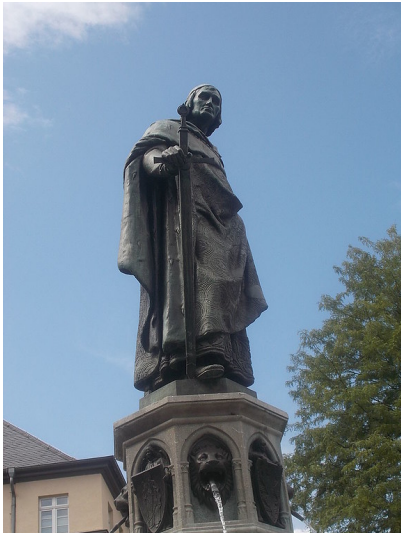
Balduinbrunnen Trier mit der lebensgroßen Bronzefigur des Kurfürsten Balduin von Luxemburg (2014).

Fachsicht(en): Kulturlandschaftspflege, Landeskunde