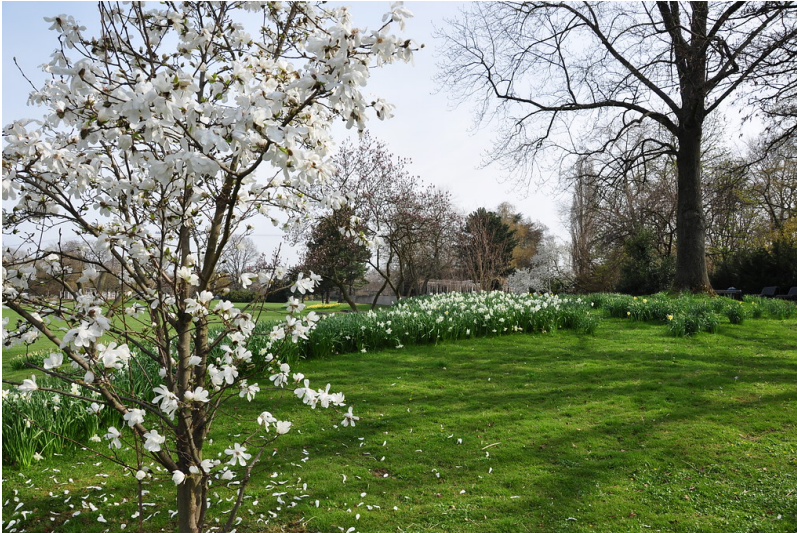
Der Deutzer Rheinpark im Frühjahr (2013).

Fachsicht(en): Kulturlandschaftspflege , Denkmalpflege , Landeskunde , Architekturgeschichte