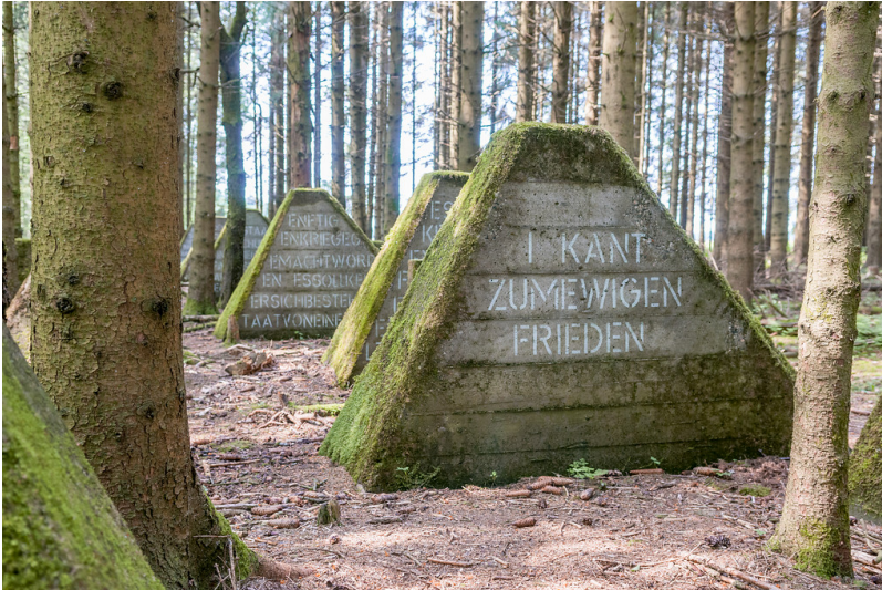
Hellenthal, Hollerather Knie. Panzersperre des Westwalls, Höckerlinie (2018)