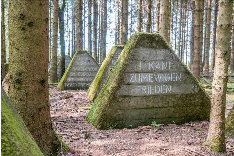
Hellenthal, Hollerather Knie. Panzersperre des Westwalls, Höckerlinie (2018)