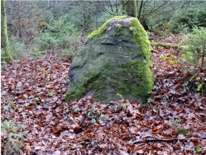
Ritterstein Nr. 115 Glashütte 1767 bei Mölschbach (2018)