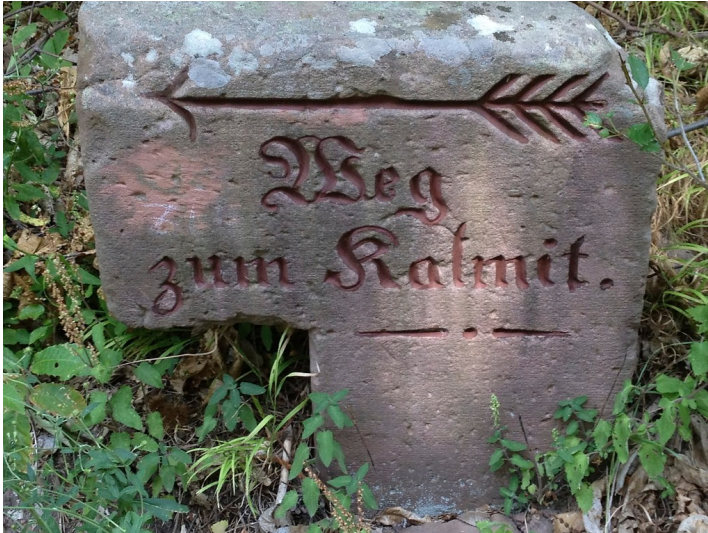
Beschriftete Steine im Pfälzerwald (2012): Sandstein im Pfälzerwald mit der Inschrift "Weg zum Kalmit".