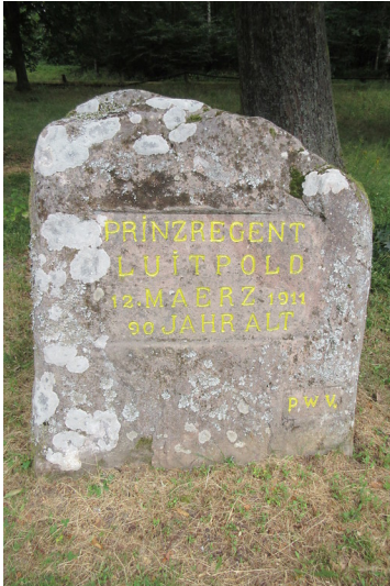
Ritterstein Nr. 70 "Prinzregent Luitpold 12. März 1911 90 Jahre alt" bei Hermersbergerhof (2018)

Fachsicht(en): Kulturlandschaftspflege, Landeskunde